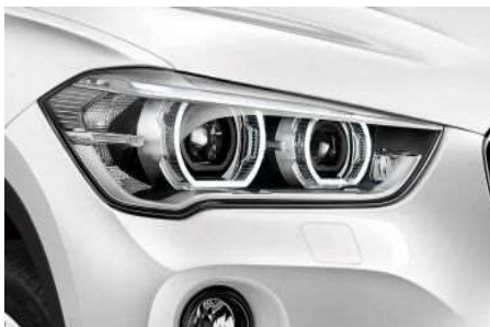
5A4_Фары LED с расширенным содержанием

Светодиодные фары дальнего и ближнего света с функцией освещения поворотов отличаются ярким светом, очень близким к дневному.