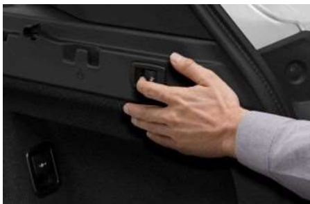
4FD_Регулировка задних сидений

Задние сиденья, разделенные в соотношении 60:40, можно регулировать по отдельности. В зависимости от потребностей можно увеличить пространство для ног пассажиров или полезный объем багажника.