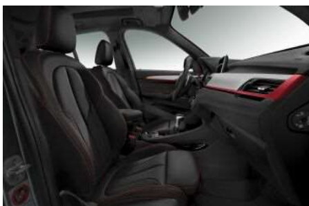
481_Спортивные сиденья для водителя и переднего пассажира

Спортивные сиденья для водителя и пассажира имеют улучшенную боковую и поясничную поддержку, а также расширенные возможности настройки их глубины и наклона. Это позволит Вам прочувствовать всю остроту и динамику Вашего BMW без потери привычного ощущения комфорта.