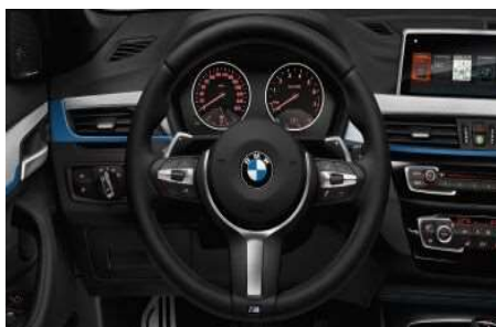
710_Кожаное рулевое колесо M

Трехспицевое кожаное рулевое колесо M с мультимедийной, ободом из черной кожи Walknappa и эргономичными упорами для больших пальцев