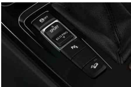
223_Dynamic Damper Control

Система позволяет адаптировать настройки амортизаторов к текущим условиям и повысить тем самым комфорт и динамику движения. Наряду со стандартной настройкой COMFORT, которая обеспечивает более высокий уровень комфорта, предлагается режим SPORT. В этом режиме амортизаторы становятся жестче, автомобиль становится "острее" в реакциях и приобретает более спортивные настройки