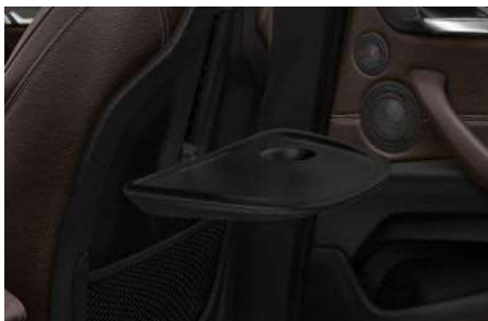
4UV_Задние откидные столики

Столики в задней части салона встроены в спинки передних сидений, они имеют достаточно большой размер и легко откидываются одним движением руки.