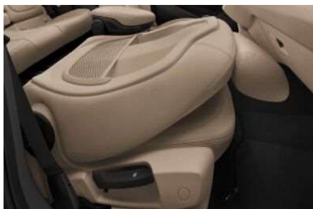
4FR_Откидная спинка сиденья переднего пассажира

Сиденье переднего пассажира со складной спинкой подчеркивает обширные возможности трансформации салона и продуманность его концепции.