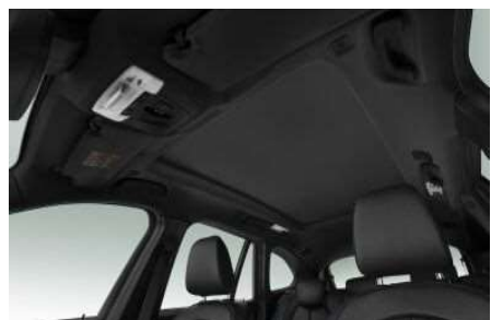
775_BMW Individual обивка потолка салона "Антрацит"

При выборе данной опции изменяется оформление потолка салона, стоек дверей, потолочных ручек и солнцезащитных козырьков на глубокий чёрный цвет, что позволяет сфокусировать взгляд водителя на дороге и придать ощущение "кокпита".