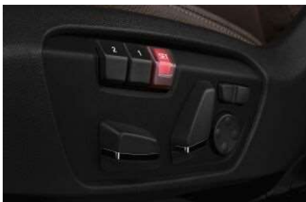
459_Электрорегулировка кресел с памятью

Электрорегулировка сидений упрощает их настройку, а функция памяти позволяет запомнить наиболее удобное положение для сиденья и зеркал заднего вида.